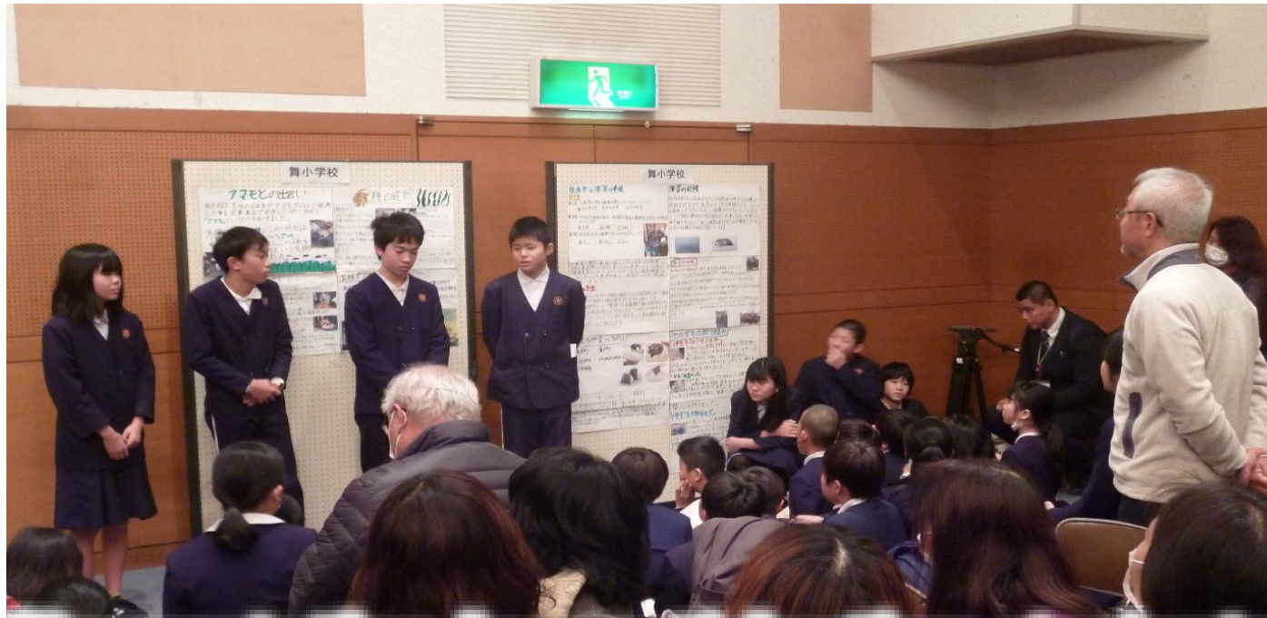
<Presentation by participating students>