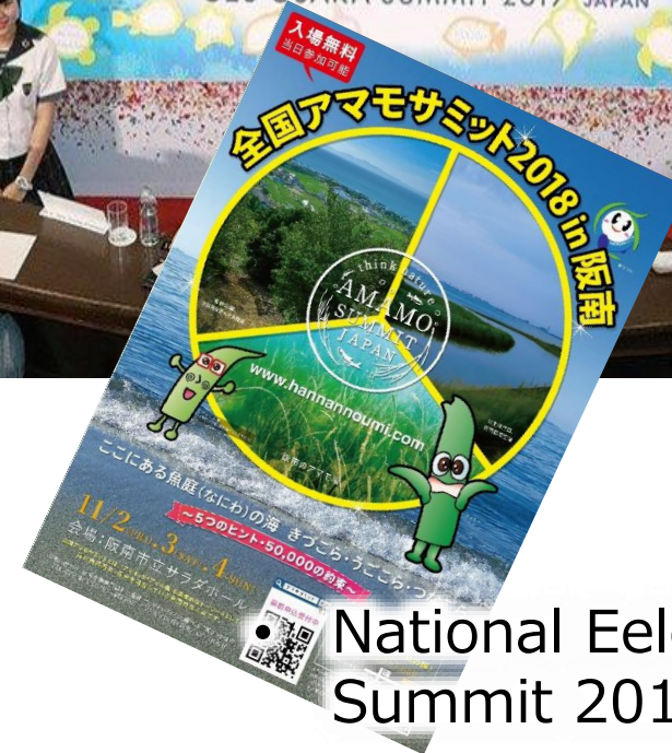
National Eelgrass Moth Summit 2018 in Hannan