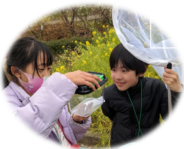
捕まえたのは日本ミツバチ