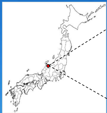
■ Map of Japan