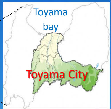
■ Toyama Prefecture