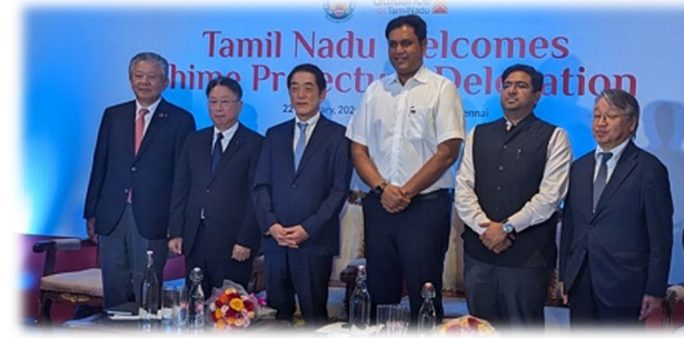
インド・タミルナドゥ州 (2024年1月)