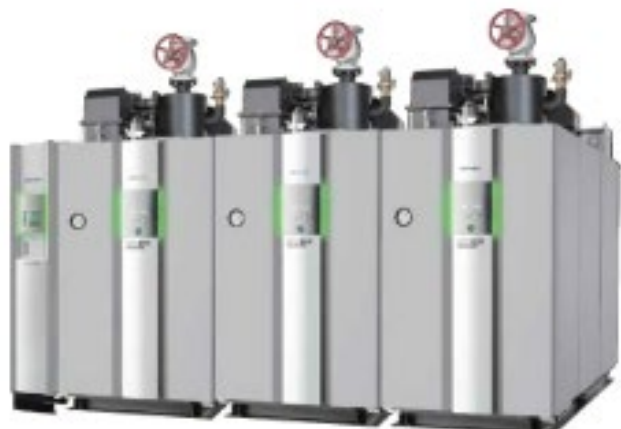
省エネルギー性能が 高いボイラー