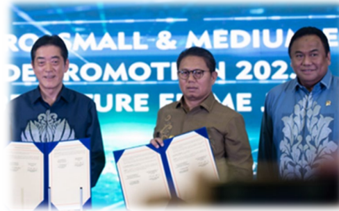
インドネシア・ゴロンタロ州 (2023年1月)