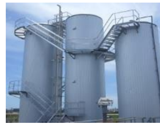
工場排水からの高効率な バイオガス(エネルギー)回収装置