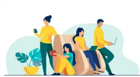
ឧបករណ៍ឌីជីថល