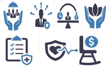
ការបញ្ចូលទៅក្នុងសេដ្ឋកិច្ចក្នុងប្រព័ន្ធ