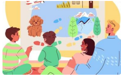
ការបង្កើតក្តីស្រមៃ