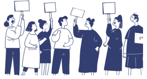
ឆ្ពោះទៅកាន់ក្តីស្រមៃរបស់អ្នក