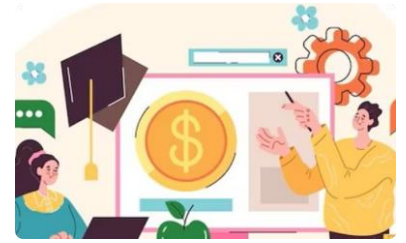
ចំណេះដឹងផ្នែកហិរញ្ញវត្ថុ