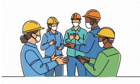
សុខភាព និងសុវត្ថិភាពការងារ