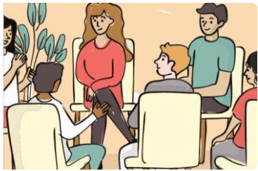
ការណែនាំ និងការស្តារលក្ខណៈ

មេរៀនគ្របដណ្តប់លើប្រធានបទសំខាន់ៗ ដូចខាងក្រោម៖