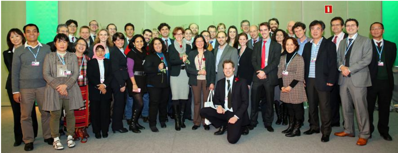
REDD+ negotiators at COP19